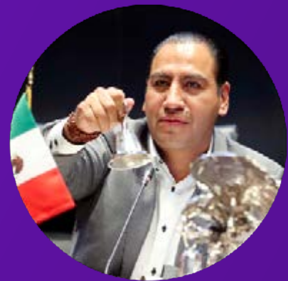
Senador Eduardo Ramírez Presidente de la Mesa Directiva Del Senado de la República