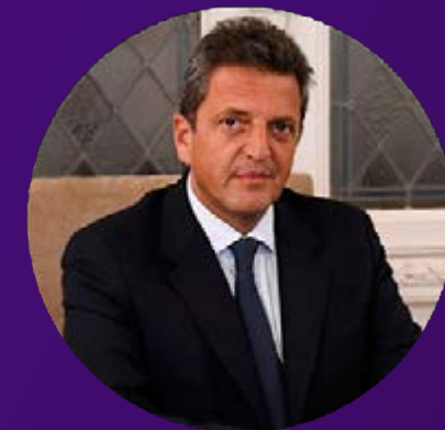
Diputado Sergio Massa Presidente de la Cámara de Diputados Argentina.