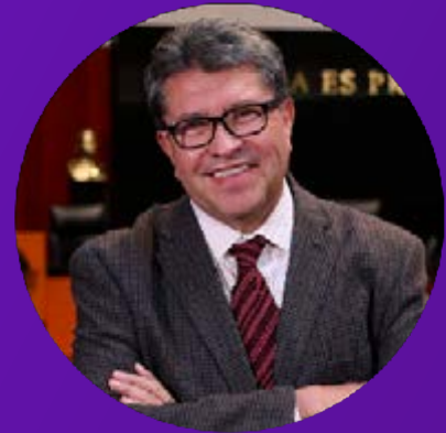
Senador Ricardo Monreal, Presidente de la JUCOPO del Senado de la República.